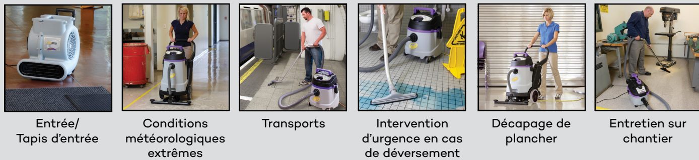
Entrée/ Tapis d'entrée